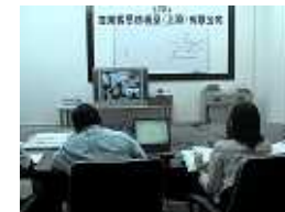
テレビ会議システム