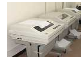
伝票用プリンター