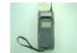
ハンディターミナル