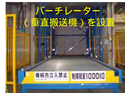
バッチレーター (垂直搬送機)を設置