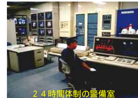
24時間体制の警備室