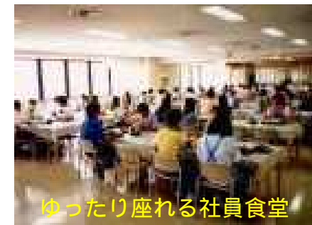
ゆったり座れる社員食堂