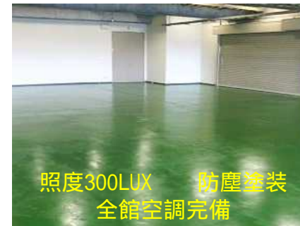
照度300LUX 防塵塗装 全館空調完備

社員食堂、売店、各階休憩室、会議室 各階トイレ・洗面・給湯室、 各区画空調設備完備